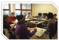
Salle de classe