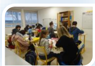
Salle de classe